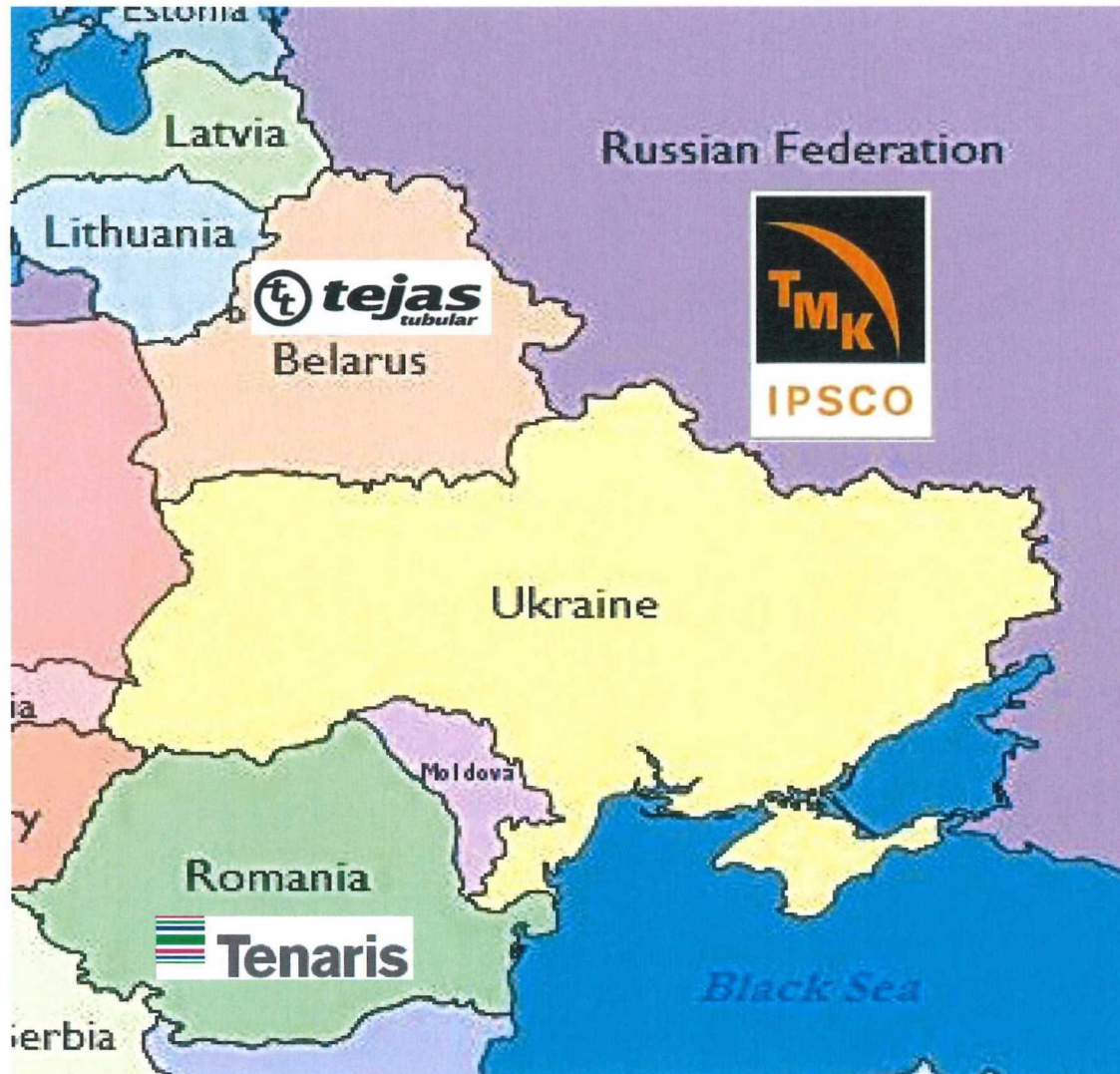
2011-2013 U.S. Imports